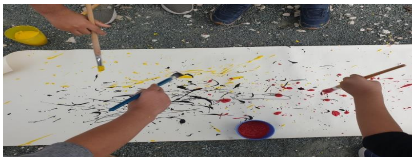
Ζωγραφίζουμε σαν τον Jackson Pollock με μουσική jazz.

Τα παιδιά πρέπει να μάθουν να αναγνωρίζουν τα συναισθήματα τους καθώς και τα συναισθήματα των άλλων. Να μάθουν να βρίσκουν τρόπους να τα ελέγχουν (ας μην ξεχνάμε ότι τα παιδιά του νηπιαγωγείου βρίσκονται νοητικά στο στάδιο του εγωκεντρισμού). Είναι επίσης σημαντικό να μάθουν πως να τα εκφράζουν, ούτε υπερβολικά ούτε μέτρια.