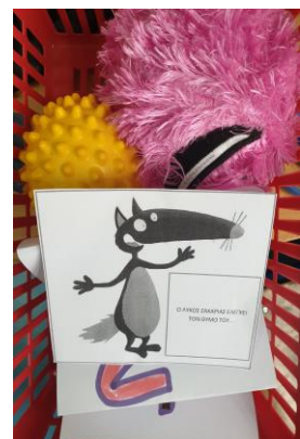
Σταματώ, ηρεμώ, μιλώ...